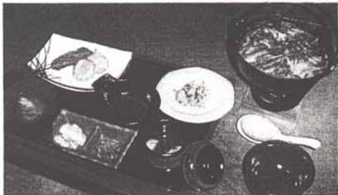
かいもち鍋・かいもち天ぷら、フライ・そば粉入りがんも そば粉焼き(お好み焼き風)・そばもちぜんざい・漬物

地元産野菜を使ったかいもちメニューです。愛情たっぷりの手作り料理を食べてみてください。